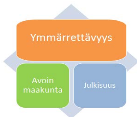
Kuva 3 Toimintasuunnitelman teemat 2017-2019