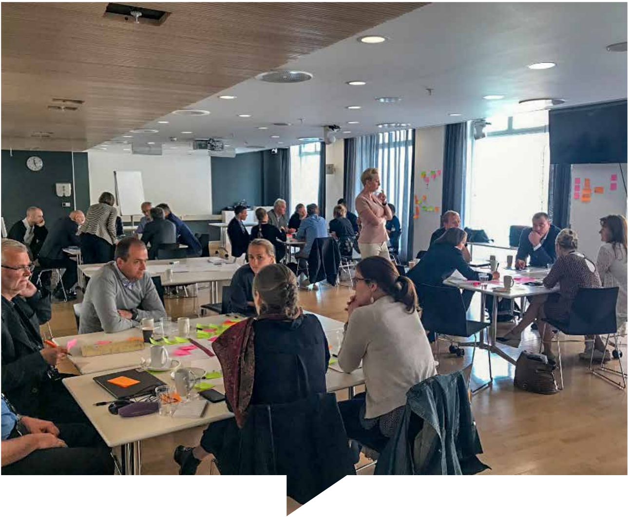
Et ledd i arbeidet med Handlingsplan 4 var møtet mellom departementene og det sivile samfunn 19. juni 2018.