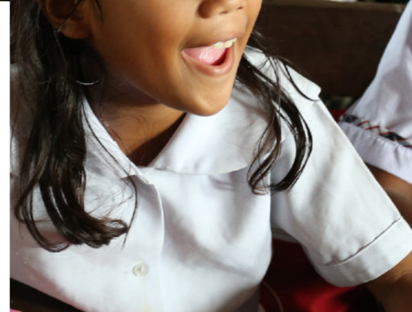
Alumnos de la escuela primaria Bislig en la ciudad de Tanauan, provincia de Leyte, Filipinas. Los servicios públicos continúan siendo un área de trabajo popular para los miembros de OGP. El programa de entradas a la educación básica de Filipinas se presenta en la página opuesta.

La provisión eficiente, accesible y abierta de los servicios públicos más importantes – salud, educación, agua y saneamiento – puede transformar la vida de la ciudadanía y mejorar su confianza en el Gobierno. Debido al enorme impacto de estos servicios en las comunidades y la proporción significativa de los gastos públicos que estos representan, la ciudadanía tiene derecho de participar en los procesos de selección de los proyectos de servicios públicos y monitorear su implementación. Integrar los principios de gobierno abierto en la provisión de servicios puede ayudar a ampliar el alcance de dichos servicios, promover mecanismos de retroalimentación y dar la oportunidad a la ciudadanía de monitorear la provisión y la calidad de los servicios públicos. Los siguientes son ejemplos de compromisos sobre servicios públicos que incluyen los planes de acción de 2019.