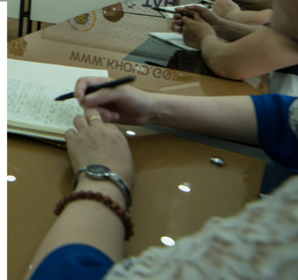
La Agencia de Educación de Mongolia se reúne con la comunidad local en Khovd. El compromiso destacado de Mongolia (página opuesta) tiene como objetivo aumentar la participación de los ciudadanos y las organizaciones de la sociedad civil en los procesos de adquisiciones públicas.

A nivel mundial, los Gobiernos gastan aproximadamente 9 billones y medio de dólares (15% del PIB mundial) en contratos con empresas para adquirir bienes y servicios. Estos contratos representan el mayor riesgo de corrupción para los Gobiernos . La publicación de contratos del Gobierno y el establecimiento de procesos de licitación abiertos y justos puede reducir este riesgo, permitiendo a la ciudadanía y a la sociedad civil monitorear los pagos que sus Gobiernos realizan. Además, lo anterior puede resultar en mejoras a la eficiencia del Gobierno y relación calidad-precio, además de establecer condiciones equitativas para las empresas, incluso para las pequeñas. La contratación abierta ha sido un tema popular en OGP desde hace varios años y muchos miembros se han enfocado en publicar información. Más recientemente, los nuevos compromisos se empiezan a enfocar en la creación de metodologías para el diseño y monitoreo de procesos de contratación.