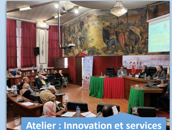
Atelier : Innovation et services de proximité 20 octobre 2022