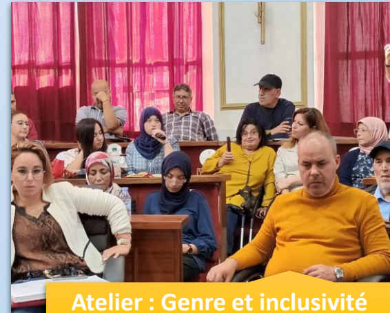
Atelier : Genre et inclusivité sociale 19 Octobre 2022