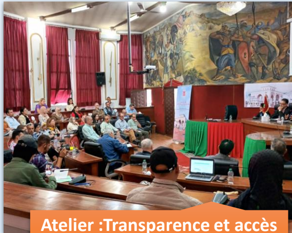
Atelier : Transparence et accès à l'information 12 Octobre 2022