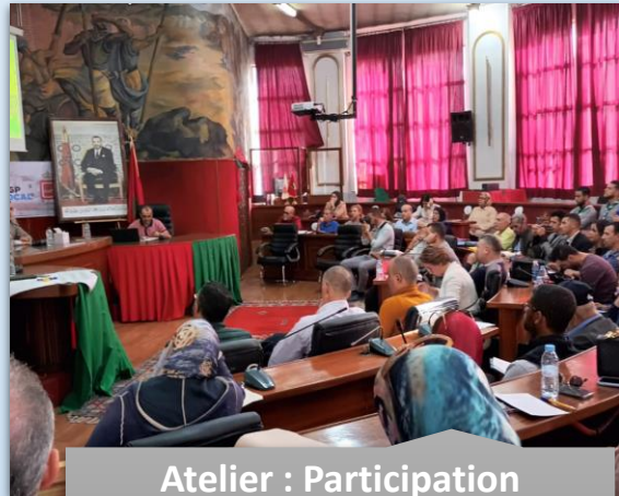
Atelier : Participation citoyenne 13 Octobre 2022