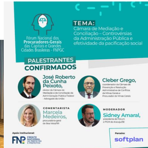
Foto 04 - participação da Procuradora-Geral do Município de Contagem na sessão Câmara de Mediação e Conciliação – Controvérsias da Administração Pública e efetividade de participação social no Fórum Nacional dos Procuradores-Gerais das Capitais e Grandes Cidades Brasileiras – FNPGC, em agosto de 2024.