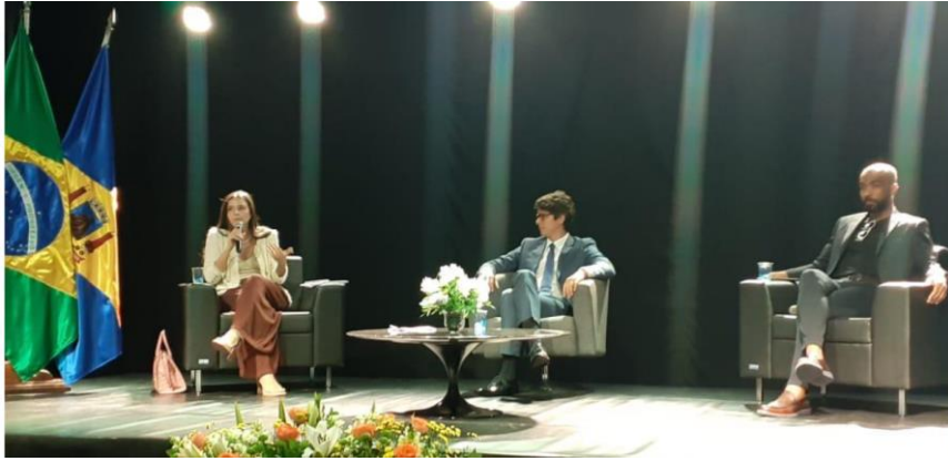
Foto 01 - participação da Procuradora-Geral do Município de Contagem no II Seminário Municipal da Integridade, Transparência e Combate à Corrupção de Itabirito, em 05 de novembro de 2022.