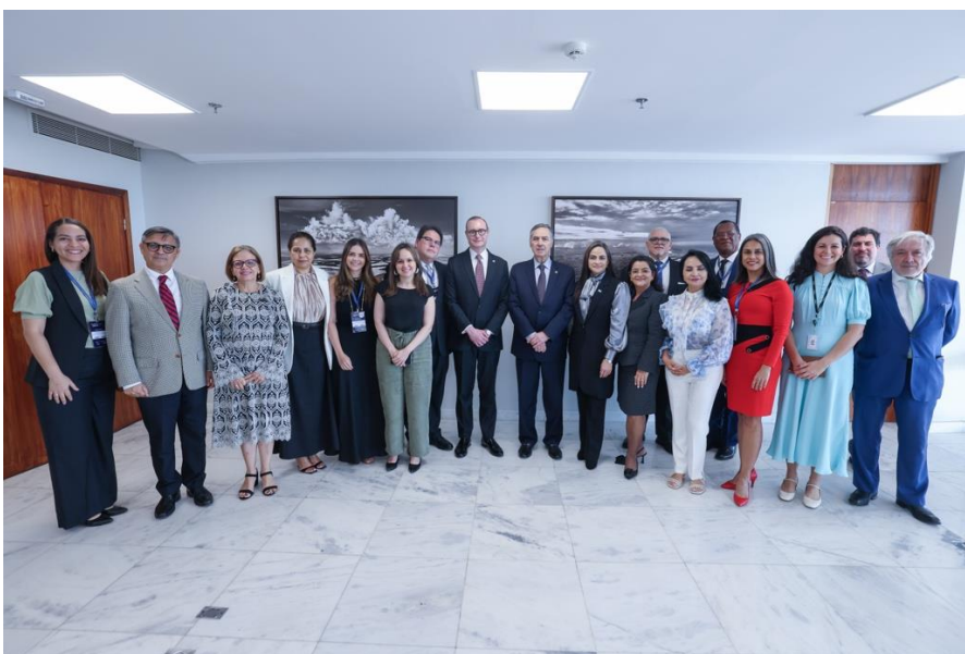
Foto 05 – registro fotográfico e programação do side event: O poder de Abertura no Sistema de Justiça: Experiências na América Latina no América Aberta, em dezembro de 2024, América Aberta.